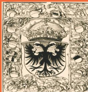
Die Wappen der Eidgenössischen Orte und der wichtigsten Zugewandten, 1507 (Titelseite der ersten gedruckten Schweizer Chronik von Etterlin)