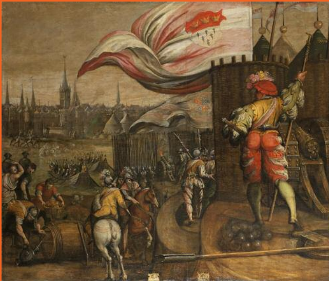
Das Kölner Entsatzheer 1475 vor Neuss (1582), Ölgemälde von Arnold Colyns, Kölnisches Stadtmuseum KSM 1987/502